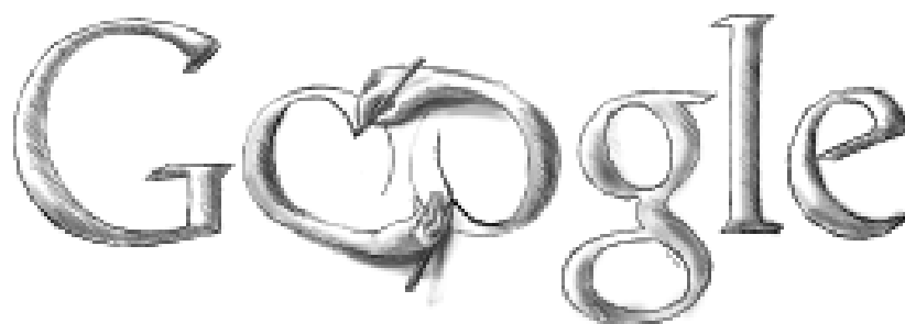
M. C. Escher (16 de junio de 2003*) Aniversario de su nacimiento (**)