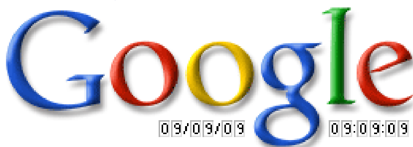
09/09/09 a las 09:09:09 (9 de septiembre de 2009*)