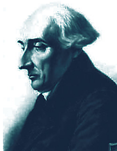
JOSEPH-LOUIS LAGRANGE (1736-1813)

Lo primero que hemos de tener en cuenta es que la ciencia estudia los fenómenos que cambian, o si se quiere, los cambios que sufren los fenómenos. Aquello que es inmutable se puede definir, pero sin cambio no hay análisis. Sin embargo, los procesos del Universo, de la materia o de la energía que varían, en general con el transcurso del tiempo, son los que preocupan a los científicos. Y para estudiarlos se asignan a cada momento o a cada estado el valor de la magnitud que se estudia.