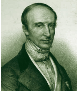
AUGUSTIN CAUCHY (1789-1857)

Cauchy realizó una extraordinaria labor para sistematizar el concepto de función. Pero no es el único.