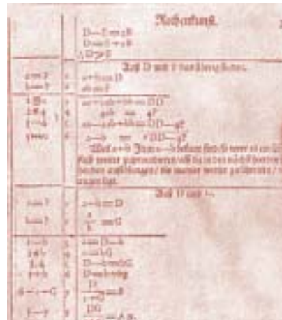
PÁGINA DEL TEXTO DE RAHN EN EL QUE APARECEN IMPRESOS MÚLTIPLES SÍMBOLOS ALGEBRAICOS Y POR PRIMERA VEZ +