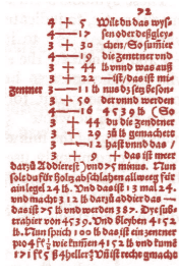
PRIMER TEXTO IMPRESO DE LOS SÍMBOLOS + Y - EN LA OBRA DE JOHANNES WIDMAN BEHENDDE VND HÜPSCHE RECHNUNG . Edición Augsburg de 1526