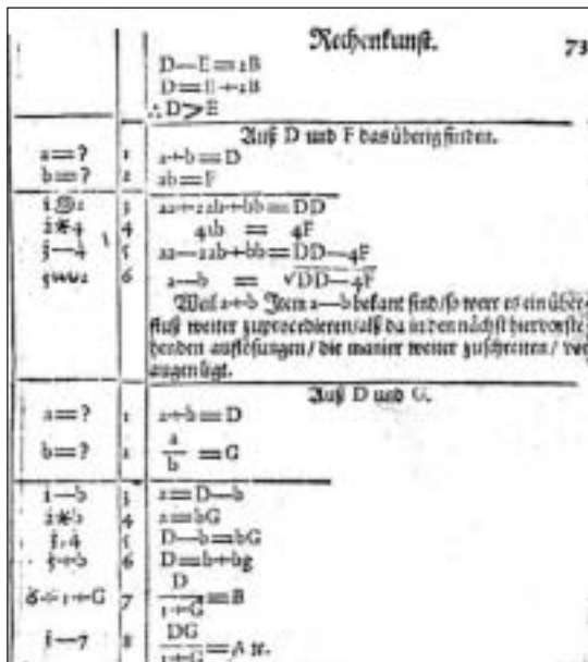
PÁGINA DEL TEXTO DE RAHN EN EL QUE APARECEN IMPRESOS MÚLTIPLES SÍMBOLOS ALGEBRAICOS Y POR PRIMERA VEZ ÷

El asterisco para representar la multiplicación proviene de JOHANN RAHN (1622-1676), quien en 1659 lo usó en su libro Teutsche Algebra .