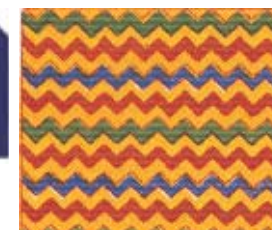
2 y 3