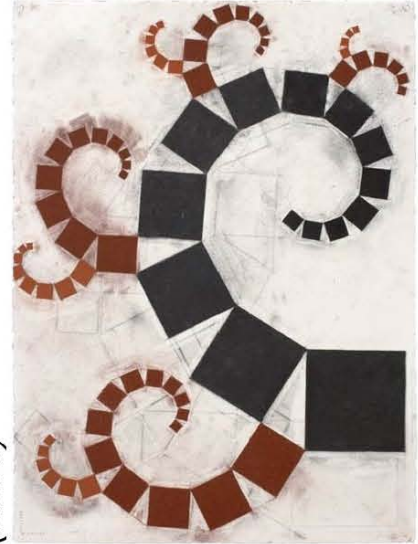
Pitágoras (2) (2006)