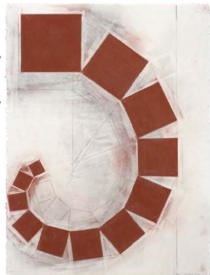
Pitágoras (4) (2006)