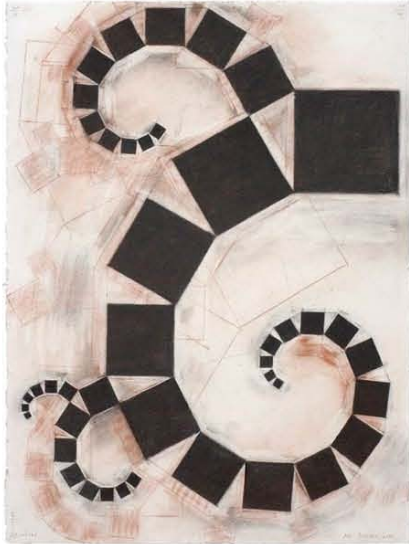
Pitágoras (1) (2006)