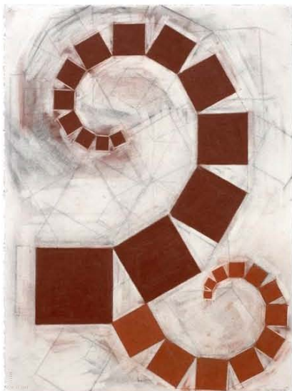
Pitágoras (3) (2006)